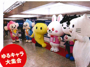
ゆるキャラ 大集合

昨年、大好評だったドゥーストリオによる生演奏ステージや 各種クイズ大会、輪投げ、ガラポン、はかりチャレンジ、 スタンプラリー、ゆるキャラ大集合など盛りだくさん。 小さなお子様からお年寄りまで家族で楽しめるイベントです!!