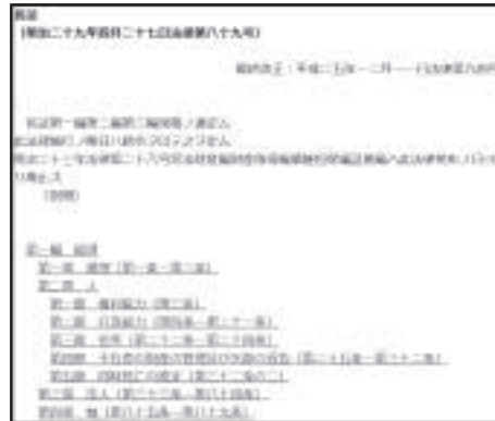
法令データ提供システム(インデックスのない画面)

Googleなどで「民法」などと検索すると、多くの場合トップの候補として法令データ提供システムが表示されます。ただ、普通に検索して表示されるのは下記のような左側にインデックスのない画面です。