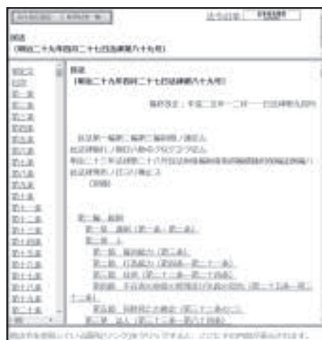
法令データ提供システム(インデックス付きの画面)

しかし、この画面は目次をクリックすると、いちいち別ウィンドウで条文が表示されるので、ちょっとうざったいところがあります。そこで、Googleなどで検索するとき「民法 cgi」と「cgi」という言葉を付加して検索してください。そうすると、下記のようなインデックス付きの画面が表示されます。この画面であれば、目次をクリックしても別ウィンドウでは表示されませんし、インデックスも使えて便利です。