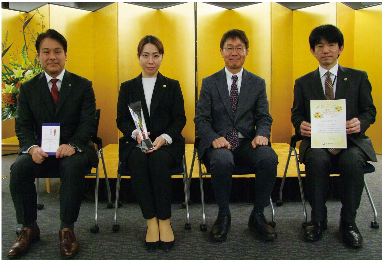
表彰式において(牛島総合法律事務所)

時短執務を行っている弁護士については、アサインされる案件の内容も配慮いたします（例えば、仮処分ではなく通常訴訟の案件をアサインする、など）。さらに、当事務所では各案件を2名～十